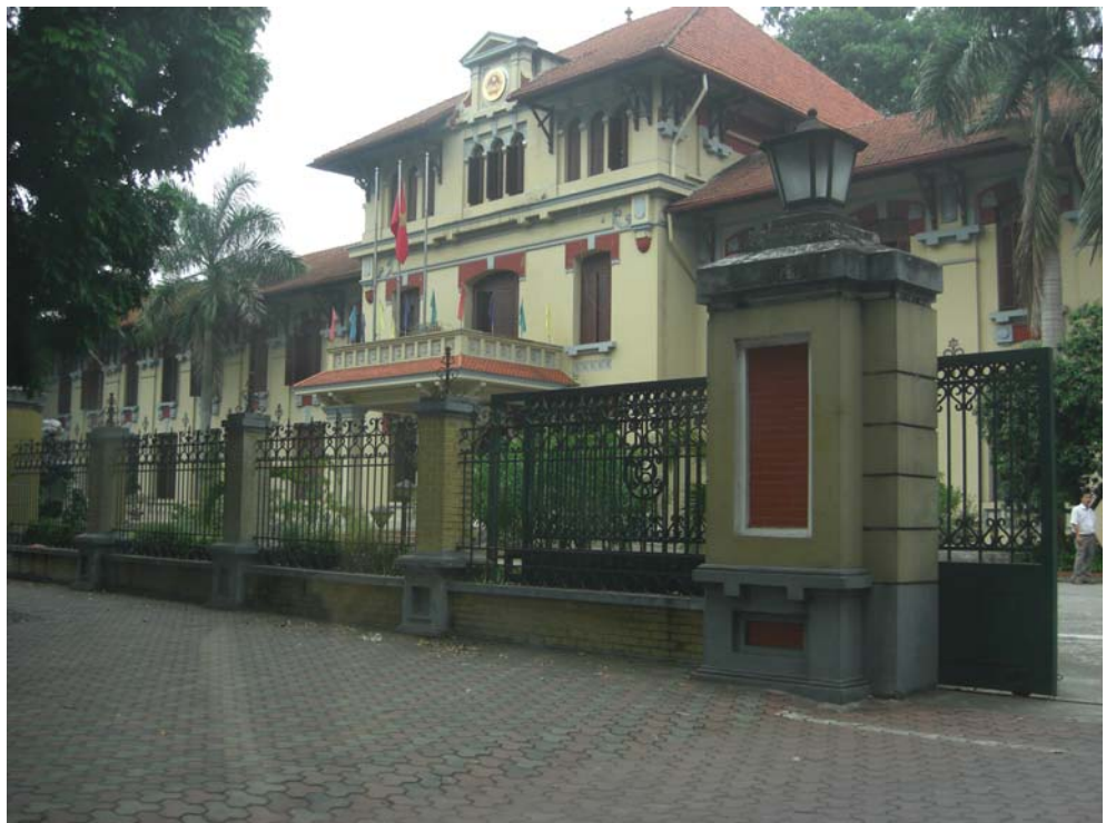
EDIFICIO EN HANOI DEL DEPARTAMENTO DE ADOPCIÓN INTERNACIONAL DE VIETNAM (DAI). MINISTERIO DE JUSTICIA